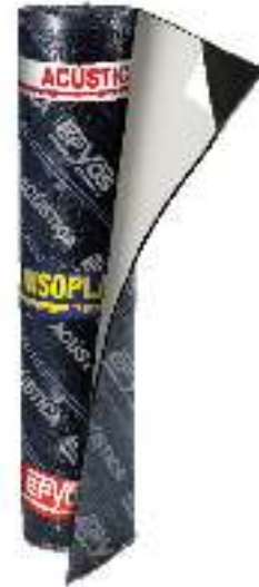
SOPREMA INSOPLAST AA