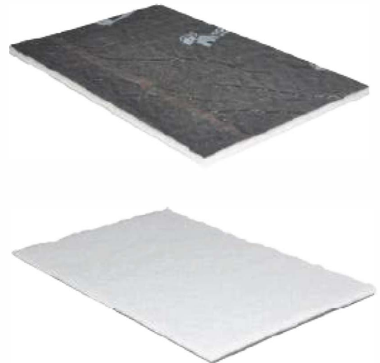
SOPREMA VELAPHONE FIBRE 22

Daha fazla bilgi ve numune talepleriniz için lütfen irtibata geçiniz. For more details, please contact with us from contact informations below.