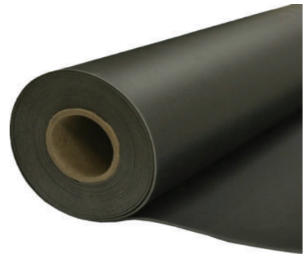
BAF HB BARIYER BAF HB BARRIER