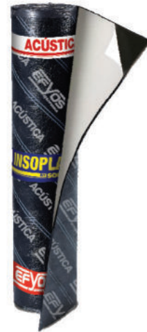
SOPREMA INSOPLAST AA