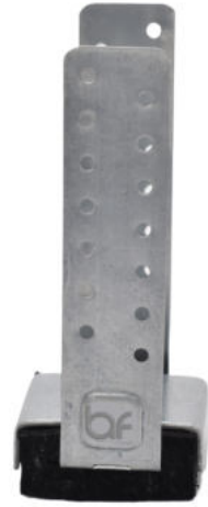
BAF IZOAGRAF 03 (DUVAR) BAF IZOAGRAF 03 (WALL)