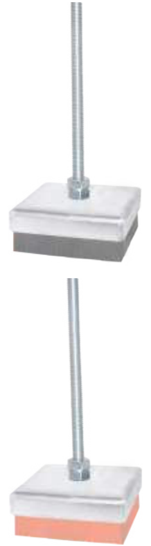
BAF IPT 50